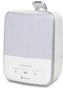
●マイクロフォグガーPRO (適用面積:約14畳)