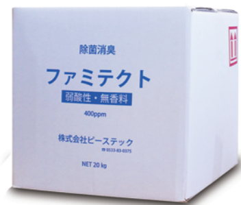
●原液 キューブ容器 20L