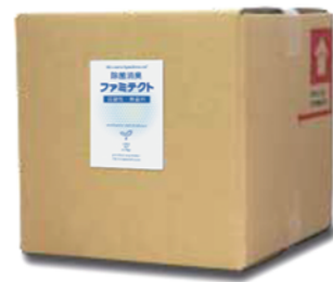
●原液 キューブ容器 10L/5L