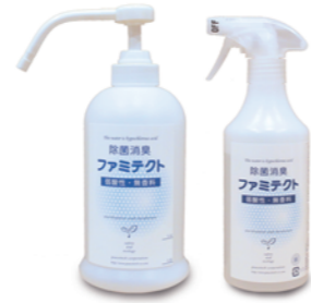
●希釈スプレーボトル 600ml/500ml