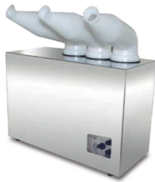
●マイクロフォグガーマスター (適用面積:約120畳)