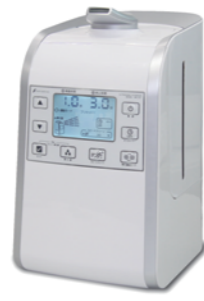
●マイクロフォグガーHG (適用面積:約26畳)